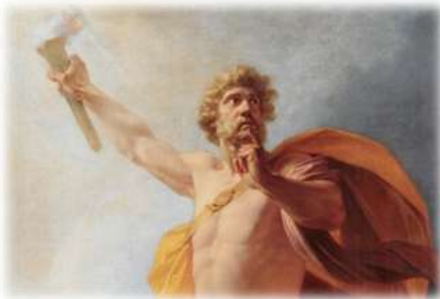
Óleo en lienzo de Heinrich Friedrich Füger: Prometeo lleva el fuego a la humanidad (ca. 1817)