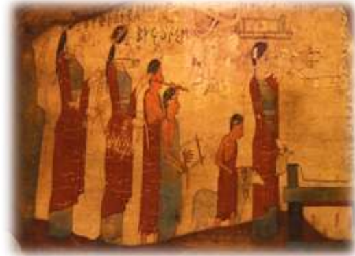
Procesión del sacrificio de un cordero a las Cárites, pintura sobre madera, Corintia, hacia 540-530 a.C., Museo Arqueológico Nacional de Atenas

Estas características del pensamiento mitológico daban lugar a dos rituales que jugaban un papel fundamental en la vida de todo ciudadano de, por ejemplo, la Antigua Grecia. El primero de ellos es el culto o la ofrenda a los dioses. Puesto que, como hemos dicho, los dioses eran considerados como seres que podían ser agradecidos, era habitual entregar algún objeto o realizar el sacrificio de un animal en honor al dios del que se quería obtener un favor.