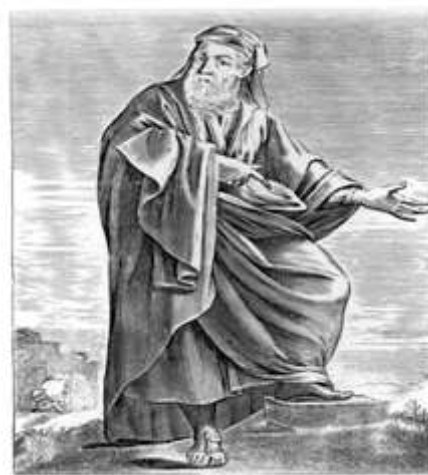
Empédocles, imagen procedente de Thomas Stanley (1655), The history of philosophy

“La cosa más difícil es conocernos a nosotros mismos; la más fácil es hablar mal de los demás”