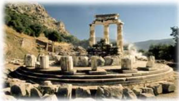
El Oráculo de Delfos , en Grecia, fue un centro de culto muy importante en la Antigüedad

Igualmente importante era la visita a los oráculos cuando se estaba inquieto o angustiado por el futuro. Allí, por medio de sacerdotes o pitonisas, las deidades respondían a las inquietudes de los ciudadanos y les aconsejaban a la hora de tomar decisiones importantes en su vida.