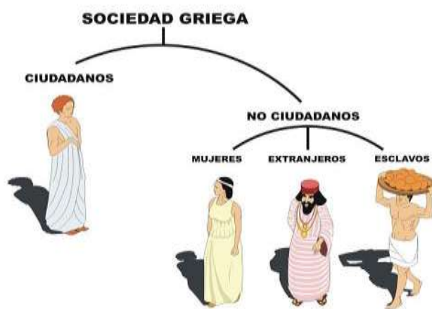
Organización de la sociedad en la Grecia clásica