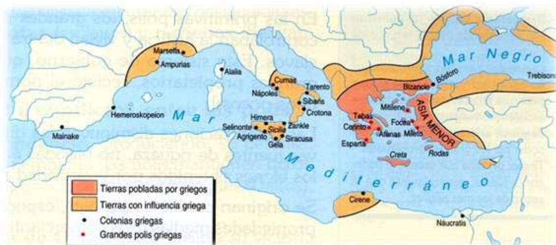
Mapa de Grecia y sus colonias entre los siglos VIII y VI a. C.