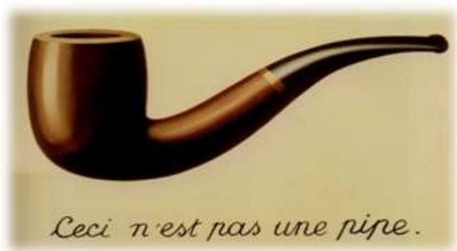
Esto no es una pipa , de R. Magritte. Pertenece a la colección La traición de las imágenes y está expuesta en el Museo de Arte del Condado de Los Ángeles, en Los Ángeles (California, EE.UU).

Pese al número de las disciplinas mencionadas, existen muchas más que se encargan de otros aspectos de la realidad. Entre ellas, podríamos mencionar, por ejemplo, la Filosofía de la historia, la Filosofía de la ciencia o la Filosofía de la naturaleza.