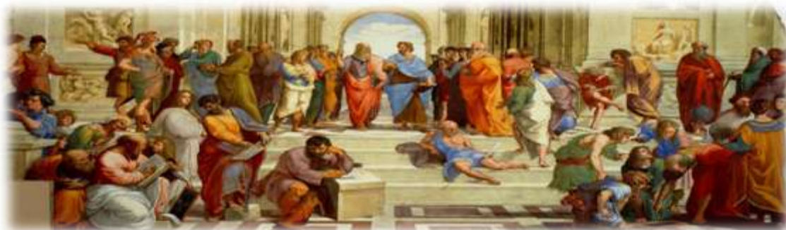
La escuela de Atenas de Rafael, Museos Vaticanos, Roma, Ciudad del Vaticano

d) Señala la oración que más te ha llamado la atención del texto y explica el porqué.